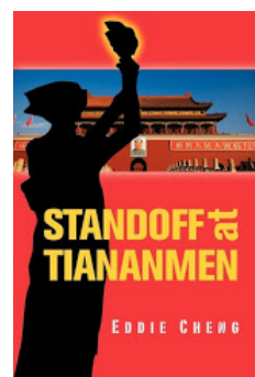
Click on the picture to purchase at Amazon