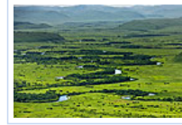
中蒙界河两岸绿毯风光