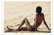
比基尼诱惑情迷斯攀瓦

除了杯子，五星级酒店还有多少秘密 获于嘉萌力挺，蒋劲夫家暴女友另有内情？ 深圳和香港的管狗对比有什么启示 没想到所有人都被敏洪带到沟里 当年家中最重要的财产是“三转一响” 金马奖红毯无PS图！最好看的竟是这位